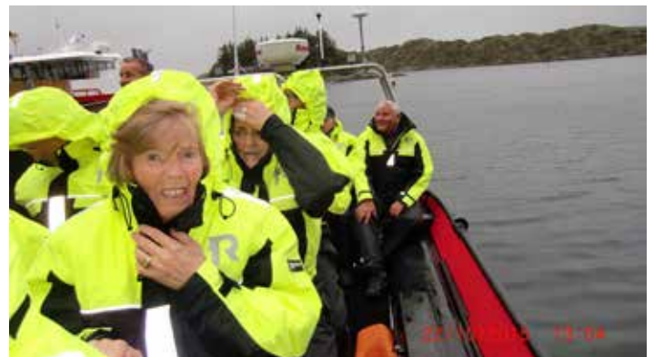
Kalde hordalendinger på høsttur.

Flott orientering om historie og laks fra tilblivelse og frem til i dag. De som ønsket det, kunne så ta på seg overlevingsdrakter og gå om bord i en RIB. Hele 14 personer ble med i blåsten og i stor fart bar det utover mot oppdrettsanlegget. Der fikk vi meget god orientering om oppdrett generelt, før vi suste tilbake til land.