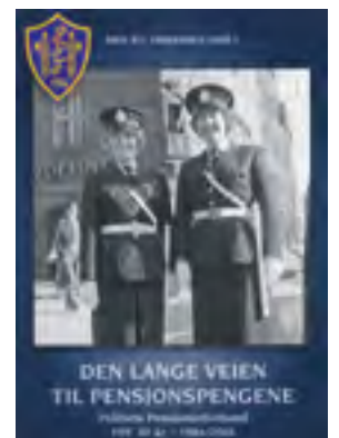
Jubileumsheftet PPF 30 år

Er det noen som tror at det ville ha blitt bedre, eller like bra, hvis pensjonistene hver for seg skulle sørget for seg? Det vil alltid stå kamp om store pengebeløp! Hvis det etableres et kraftfullt vern eller forsvar for opptjente rettigheter, er jeg optimistisk. Imidlertid kreves det et vedvarende vern som holder «kruttet» tørt, noe mindre vil være naivt å tro!