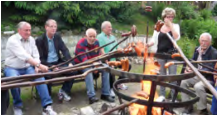
2013 Pølsegrilling – Wrocław, Polen.