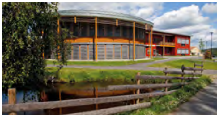
Seniorkonferansen avholdes på Sæter Gård ved Kongsvinger.

Påmeldingsfrist 1. juni 2017 med bindende påmelding.