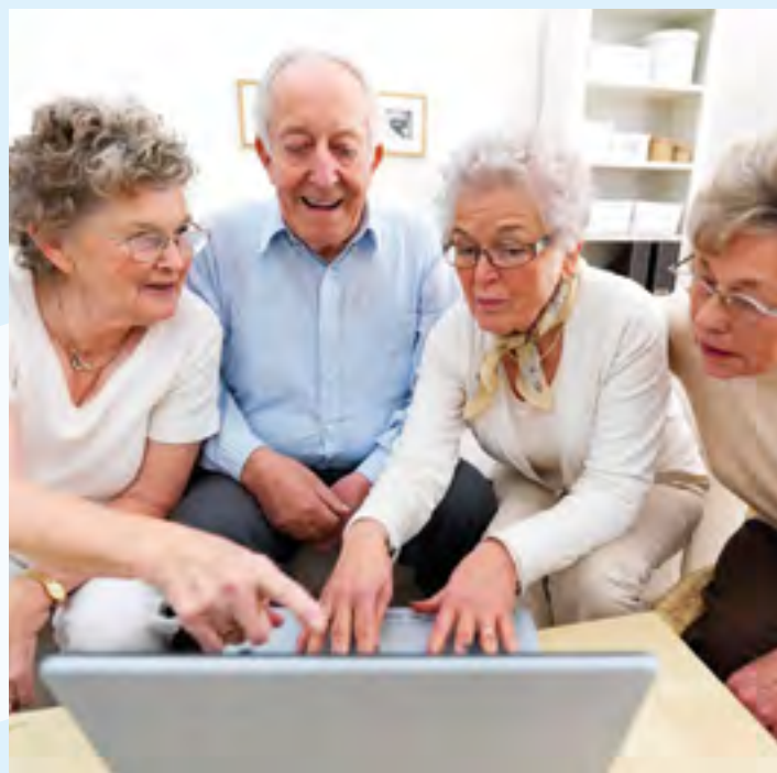
Sosiale medier som Facebook er bra hjernetrim – også for politipensjonister.

– Ideen til studien sprang ut fra to innfallsvinkler, den ene fra resultater som antyder at det å lære seg noe nytt, og ikke bli en sofapotet når man går av med pensjon, fører til bedre kognitive prestasjoner.