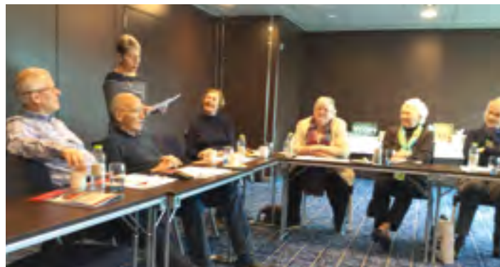
Møtedeltagere på årsmøtet.

Med slik størrelse og bemanning i politidistriktene ville det være naturlig at distriktene blir mer selvstendige enn tidligere. Spesialenheter som Kripes og Økokrim må man ha i fortsettelsen, men skal reformen virke, må politidistriktene etter behov få nødvendig bemanning, de må få bedre og nok kjøretøy, hurtiggående båter. De må også få egne helikopter slik det er i Sverige. Videre må samband og nødnett virke optimalt. til like med IKT systemene. Som et resultat av dette burde POD nedbemannes og kun være kontrollorgan for politietaten. I dag opplever vi at