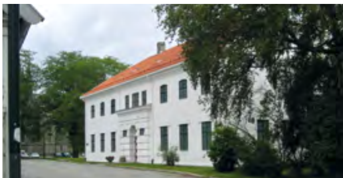
Justismuseet holder til i det gamle Kriminalasylet.