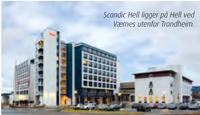
Scandic Hell ligger på Hell ved Værnes utenfor Trondheim.

I perioden 30. mai til 1. juni går Landsmøtet i Politiets Pensjonistforbund (PPF) av stabelen på Scandic Hell i Stjørdal på Værnes ved Trondheim. Et stort og flott program er tilrettelagt av polilitilagene i Trøndelag for både delegater og andre.