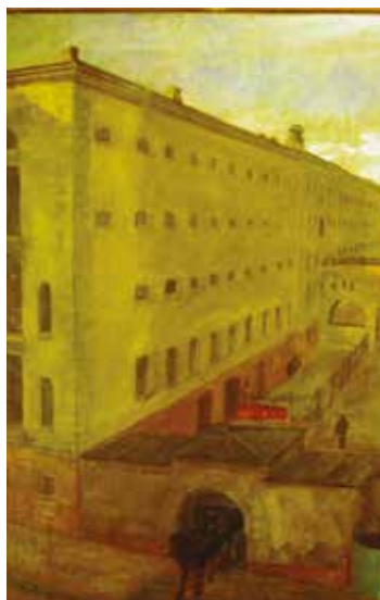
Nr. 19 - bakgård

Jeg så på ansiktet til min kollega da hun stakk hånden ned i den ene sidelommen i snekkerdressen. Helt tydelig at hun synes det var skikkelig ekkelt. Hun tok opp igjen hånda, og den var full av noe gult/hvitt slimete som rant ned mot gulvet. Kollegaen min klarte å la være å kaste opp, men det holdt hardt, det var helt tydelig. Strengt og litt ampre spurte vi den sterkt berusede – hva i all verden er det du har i lomma di? Hun tok seg kraftig sammen i sin beruselse, og klarte å si: «De lå i salgsboden, det var så fristende, jeg tok bare ett, jeg ville så gjerne ha et egg!»