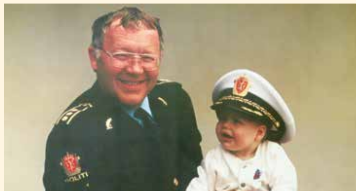
Lensmannen fyller 60 år og barnebarnet kom på besøk.