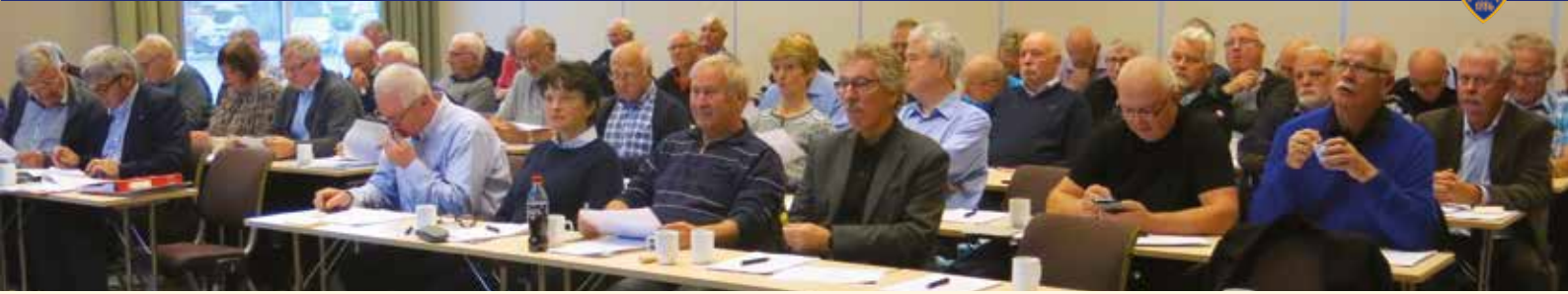
55 deltakere fra PPF fylte en av møtesalene på Gardemoen

hjemmesiden til PPF fungerer, og om hvordan man lettest kan benytte seg av denne.