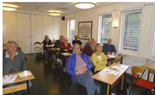
Interesserte kursdeltagere i Moss.