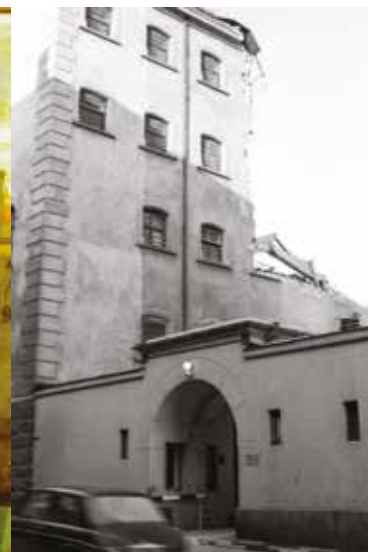
Kjøreporten til Møllergata 19.