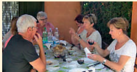
Uten mat og drikke blir det ikke rare turen. Mat må man ha!