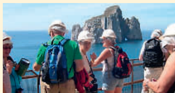
Utsikt fra graven/utskipningshavnen.