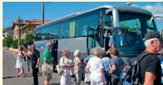
Bussen gjør seg klar til nye utflukter og spennende reisemål.