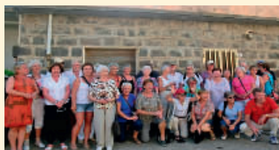
En glad og takknemlig pensjonistgjeng gjør Sardinia.

3 % til 4,7 %. Det ble ikke gitt noen begrunnelse. Og videre: «I dagens teknologiske verden må det kunne gå an å øke den fra 7,8 % for de yrkesaktive til 8 %, og tjene inn det det koster å tilbakeføre til 3% for pensjonister. Det gis ingen begrunnelse for hvorfor bare pensjonistene skal betale mer. Med en slik endring er det fullt mulig å opprettholde 3 % trygdeavgift for pensjonistene.»