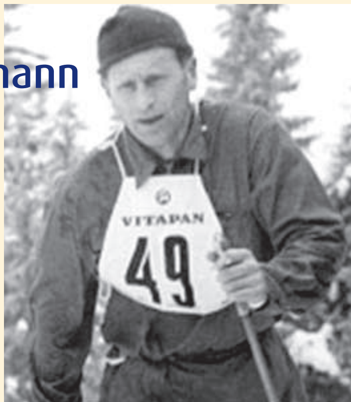
Martin Stokken i sporet.

I årene frem til 1950 så Stokken på skisporten mer som trening til friidretten, men deretter ble det langrenn som absolutt lå hans hjerte nærmest. Han fikk sølv i stafett i Oslo-OL 1952 og seier på femmila i Holmenkollen 1954 etter en spennende duell mot Sixten Jernberg. Førsteplassen på favorittdistansen, 50 km, i NM