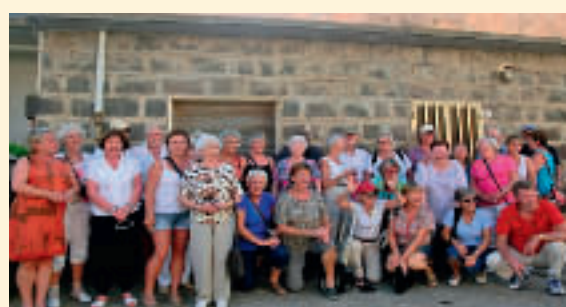
En glad og takknemlig pensjonistgjeng gjør Sardinia.

3 % til 4,7 %. Det ble ikke gitt noen begrunnelse. Og videre: «I dagens teknologiske verden må det kunne gå an å øke den fra 7,8 % for de yrkesaktive til 8 %, og tjene inn det det koster å tilbakeføre til 3% for pensjonister. Det gis ingen begrunnelse for hvorfor bare pensjonistene skal betale mer. Med en slik endring er det fullt mulig å opprettholde 3 % trygdeavgift for pensjonistene.»