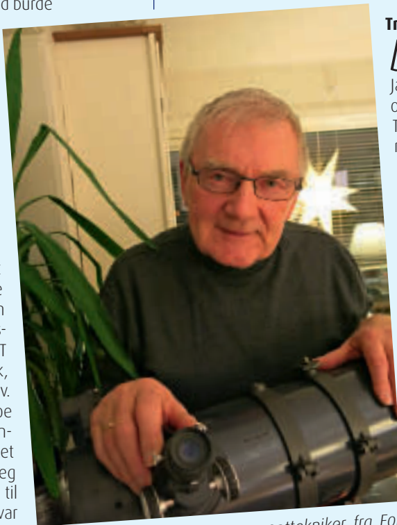
– Jeg er utdannet som instrumenttekniker fra Forsvaret innen finmekanikk og elektronikk.