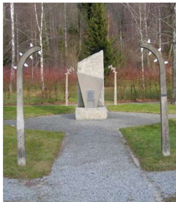
Dette frihetsmonumentet står i bakkene ved Grini.