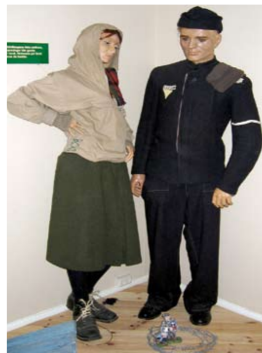
Slik så fangeuniformene ut.

alt. Rester av skrellet ble knadd og varmet opp på ovnen, høyst ulovlig naturligvis, men det ble en slags "lompe". Noen brødskorper ble bløtgjort i vann, blandet med sakarintabletter, søtstoff, og kokt, også ulovlig, men resultatet, som vi kalte "brødgrøt" ble fortært med stor appetitt. Det var ganske utrolig hva en kunne finne på å putte i munnen. Løvetann fantes ikke i hele leiområdet, og stakkars den fete meitemarken som våget seg over jordskorpen, den ble fort fortært uten salatdressing!