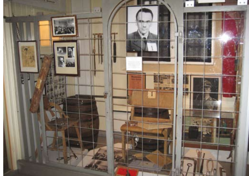
Rommet som forteller om Henry Oliver Rinnans virksomhet.

1686-1872 Stedsplassering uklar, men det er rimelig å anta at embedet ble tilknyttet Rådhuset (nåværende folkebiblioteket). Politimesteren hadde opp til fire politibetjenter til å ta seg av forvaltningsmessige