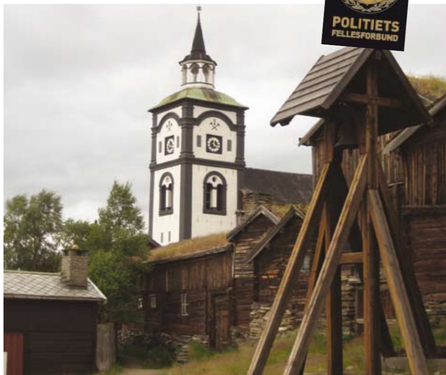
Politiets Fellesforbund avholdt sitt landsmøte på Røros.

da hadde delegatene flyttet på et medlem i styret og justert noe på noen utvalg. Avstemningen ble foretatt via SMS, og det var forunderlig å se delegaten ta fram hver sin mobiltelefon for å stemme. Så vidt jeg vet kunne sekretariatet lese hvem som stemte, eller ikke. Om de kunne lese hva den enkelte stemte vet jeg ikke. Styret har bare ett år å gjennomføre alle sakene på. Landsmøtet forkastet nemlig styrets forslag om å holde Landsmøte hvert annet år og la funksjonstiden være to år for hele styret. Det ville skapt grobunn for grundigere saksbehandling. Men delegatene var og er åpenbart utålmodige.