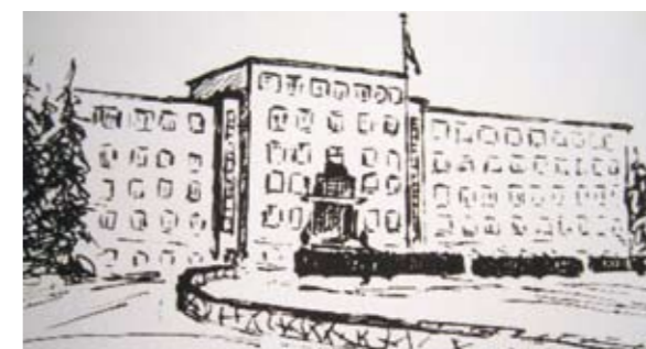
Slik så Grini ut for en krigsveteran.

Når vi ser på de titusner av navn som preger ”Norske Fange Leksikon” finner vi alle typer mennesker, alle yrkeslag, kvinner og menn fra hele Norge. Faktisk finner vi også utenlandske borgere, fanger som ble fraktet hit fra okkuperte land, fra krigs-soner i Øst-Europa, tidligere Sovjet, Polen og tidligere Jugoslavia. Disse sistnevnte var ofte såkalte krigsfanger som slet seg ut på ”Dødsveien” utbyggingen av hovedveien mot nord i Norge. Imidlertid var de fleste fangene ”en trussel” mot okkupasjonsmakten. Motstandsfolk som sørget for nyhetsformidling, Milorg-folk som organiserte militær motstand og sørget