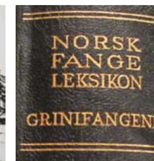
I Norsk Fangeleksikon er alle Grinifangene nevnt ved navn.

for å sikre våpenslipp, bygge skjulesteder, og påføre fienden tap ved sabotasje. Mange ble kartlagt over tid og betraktet som ”farlige” for samfunnet. De havnet i fangenskapet som gisler, og fikk grei beskjed at dersom det ble foretatt aksjoner mot nazitilhengere, transportsystemer eller offentlige institusjoner, ville de bli skutt. ”Skutt blir den som” var fast innledning til en rekke strenge paroler.