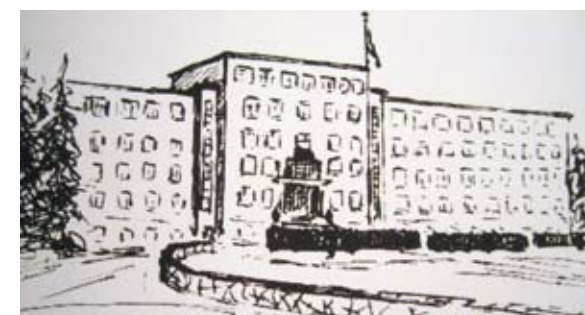
Slik så Grini ut for en krigsveteran.

Når vi ser på de titusener av navn som preger ”Norske Fange Leksikon” finner vi alle typer mennesker, alle yrkeslag, kvinner og menn fra hele Norge. Faktisk finner vi også utenlandske borgere, fanger som ble fraktet hit fra okkuperte land, fra krigs-soner i Øst-Europa, tidligere Sovjet, Polen og tidligere Jugoslavia. Disse sistnevnte var ofte såkalte krigsfanger som slet seg ut på ”Dødsveien” utbyggingen av hovedveien mot nord i Norge. Imidlertid var de fleste fangene ”en trussel” mot okkupasjonsmakten. Motstandsfolk som sørget for nyhetsformidling, Milorg-folk som organiserte militær motstand og sørget