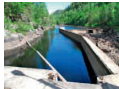
Inntaksdammen til tresliperiet.