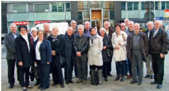
Pensjonistforbundets ledelse og SAKO-ledere samlet i Brussel.

EU har valgt 2012 som det året da eldre og pensjonister skal stå i fokus. Dette er det året da EU skal rette opp finanskrisen.