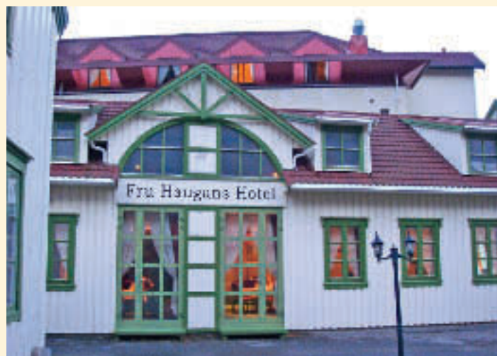
Fru Haugans Hotell i Mosjøen.