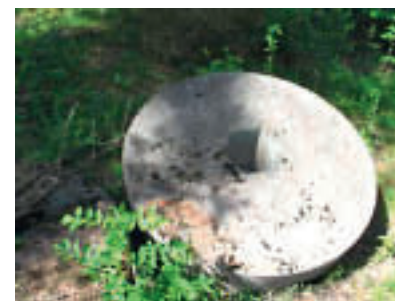
Møllesteinen gikk og gikk.

Så forlot jeg plassen ved det gamle tresliperiet og avsluttet snart min vandring for denne gang.