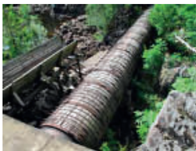
Røret fra inntaksdammen til tresliperiet.

arbeidsuken og berget lønn for denne. Da var det slutt. Det var ikke så lett å få seg annet arbeid, og særlig når det sikkert kom ut at han ikke var sterk og god nok arbeidskar lenger.