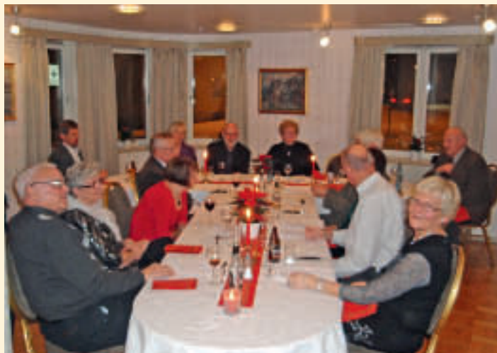
Festlyden rundt bordet.

Det var det 11. året på rad at politilaget hadde et slikt juletreff på samme sted. Politilaget har spandert nesten alt hver gang, det vil si hver deltaker måtte selv betale kr.100,- for mat og drikke (samme beløp pr. person i alle 11 år).