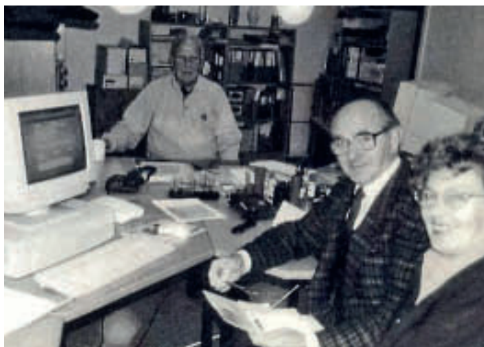
Fra kontoret i 1997.

Sommertreffet ble sløffet i perioden av økonomiske grunner.