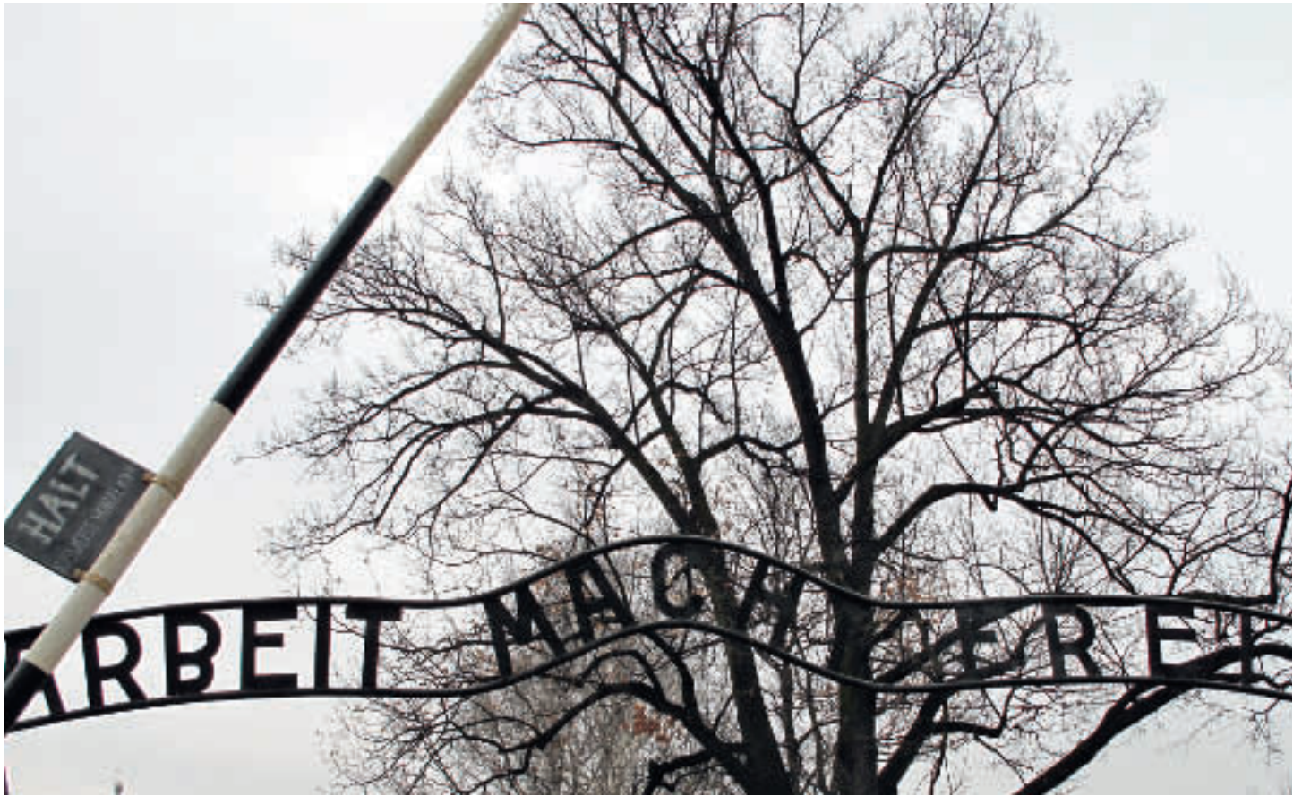
Loftesnes kjører ungdom i buss til Auschwitz – det er lærerikt på alle måter.

Av E. Eystein Loftesnes, Arendal