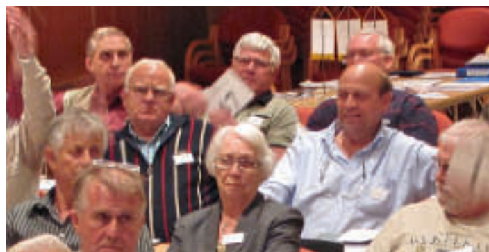
Loftesnes er også aktiv i PPF.