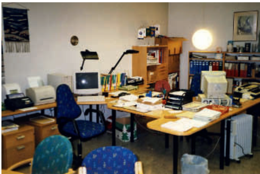
Gode kontorforhold i Politihuset Oslo.

PPF, FPF og LOP tok initiativ og dannede forløperen til Statspensjonistenes Samarbeidsutvalg (SPSU). Når