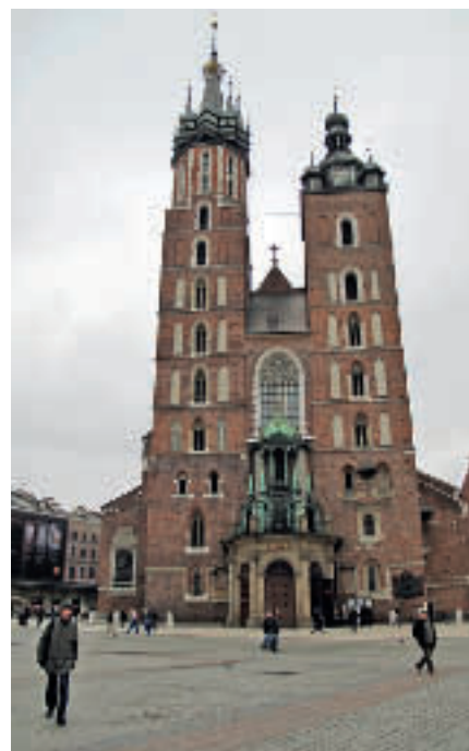
Kirken på torget i Krakow.

Jeg ønsker å dele mine erfaringer, og anbefaler dette som en del av et meningsfylt liv.