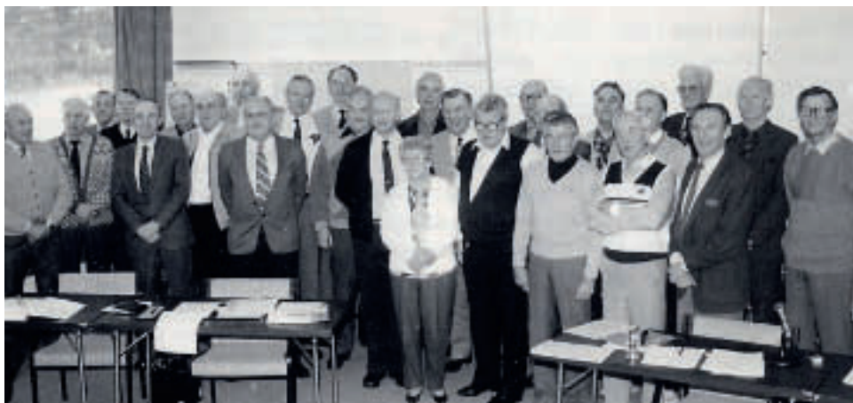
27 ivrige pensjonister på Geilo 7.-8. Januar 1986.