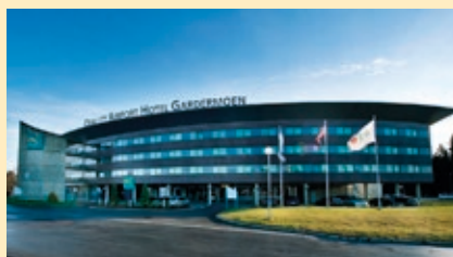
Landsmøtehotellet - Quality Airport Hotel Gardermoen.

Besøksadresse: Jessheim Nord, NO – 2050 JESSHEIM. Hotellet ligger ved motorveien Oslo/Trondheim med avkjøringsrampe Jessheim Nord. Hotellet ses tydelig fra motorveien – E-6. Det går «shuttlebuss» fra flyplassen til hotellet «uavlatelig». Bussturen tar ca. 10 minutter.