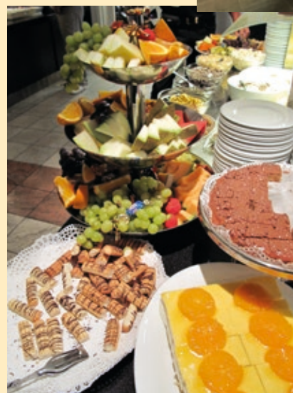
Maten er alltid førsteklases på PPFs landsmøter.