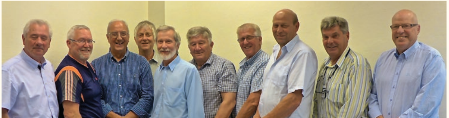
Forbundsstyret legger frem en omfattende melding siden siste landsmøte i Sarpsborg i 2013.

Politiets Pensjonistforbund (PPF) har i landsmøteperioden lagt bak seg en periode preget av stort arbeidspress ved forbundskontoret, men også med stabilitet og gledelige endringer for organisasjonen og medlemmene.