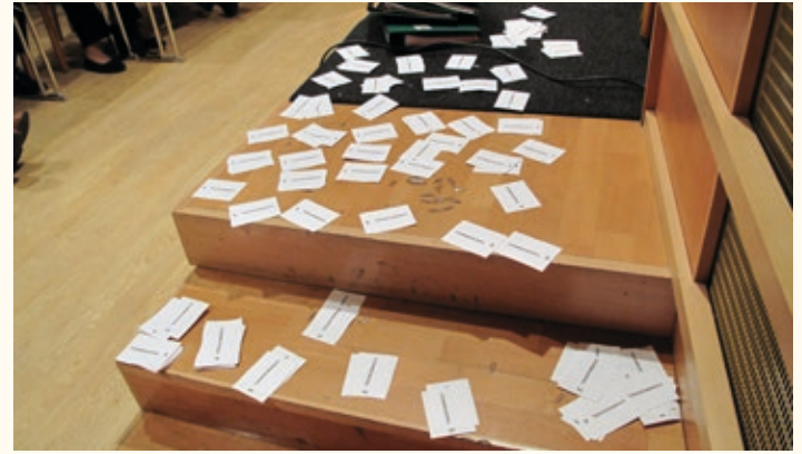
Det skal stemmes over mange saker.

Styret har hatt 11 ordinære styremøter. Protokoll fra styremøtene er godkjent i påfølgende styremøter og deretter lagt ut på vår hjemmeside.