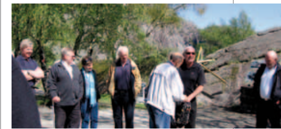
"Ut på tur, aldri sur".