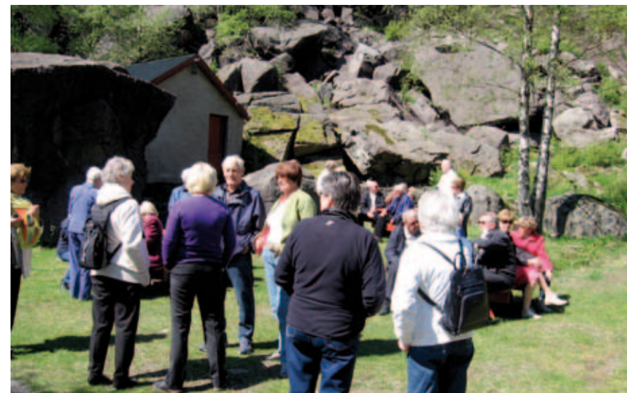
Denne gangen kunne ikke Rogalandsforeningen klage på oppslutningen eller været.