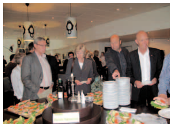
Lunsj smaker alltid godt.