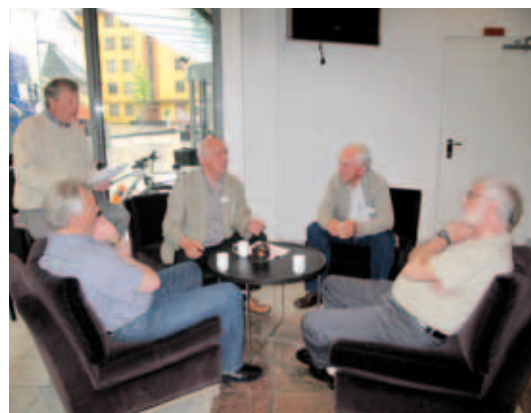
Samtaler om mangt og mye.