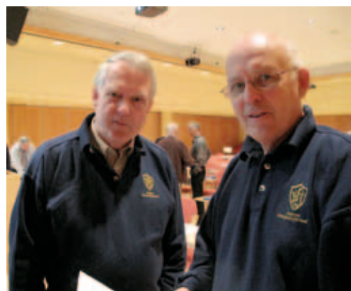
Forbundssekretæren og forbundslederen fant hverandre.