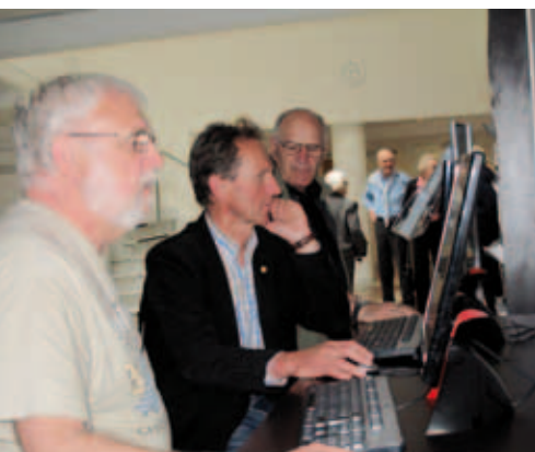
Internett sjekkes for nyheter.