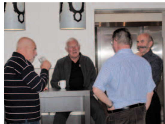
Sosialt samvær er viktig.