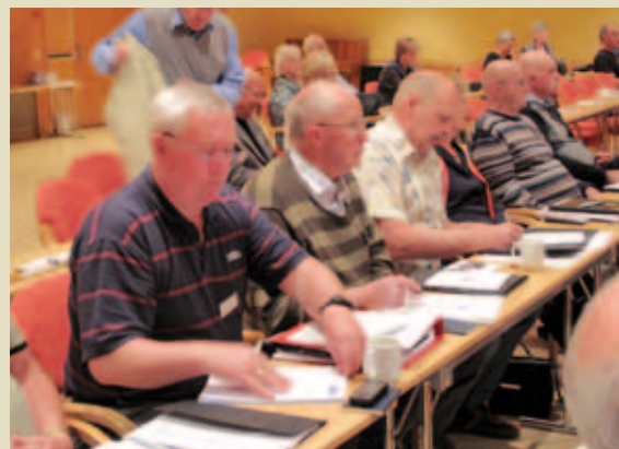
Gutter og jenter fra nord og sør.