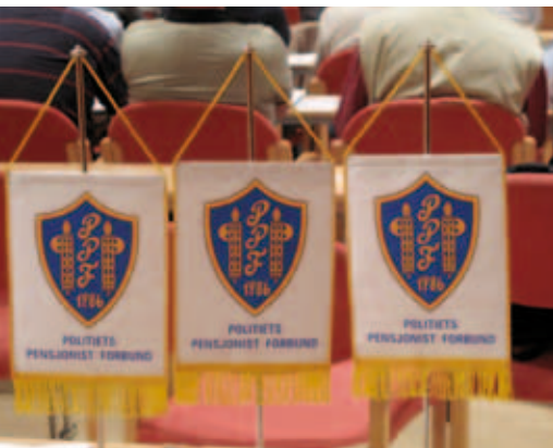
Politiets Pensjonistforbund er aktive som aldri før.