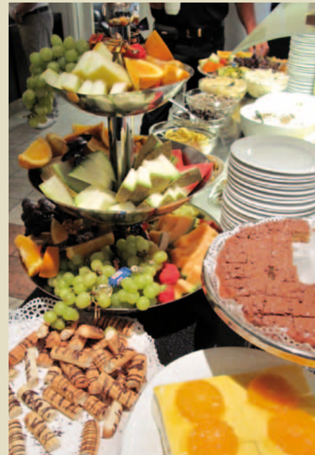
Maten kunne ingen klage på.