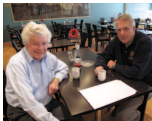
"Nu hvil deg borger" eller "Well done".