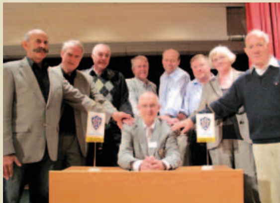
Styret med håndslaget.