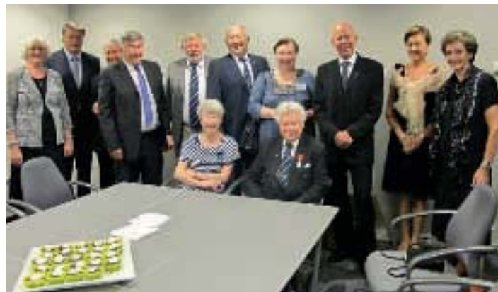
Bergensgruppen ved Landsmøtet har en spesiell samling for Moldestad.

Han var med fra starten av da IPA (International Police Ass.) Region 2 ble stiftet, og ble ved stiftelsen 18. juni 1963, innvalgt som varamann. I så måte har han hatt kontakt med kolleger over så å si hele verden.