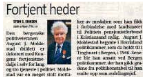
Faksimile av Bergens Tidenes første omtale av medaljeutdelingen. Siden kom det et langt intervju med Moldestad.