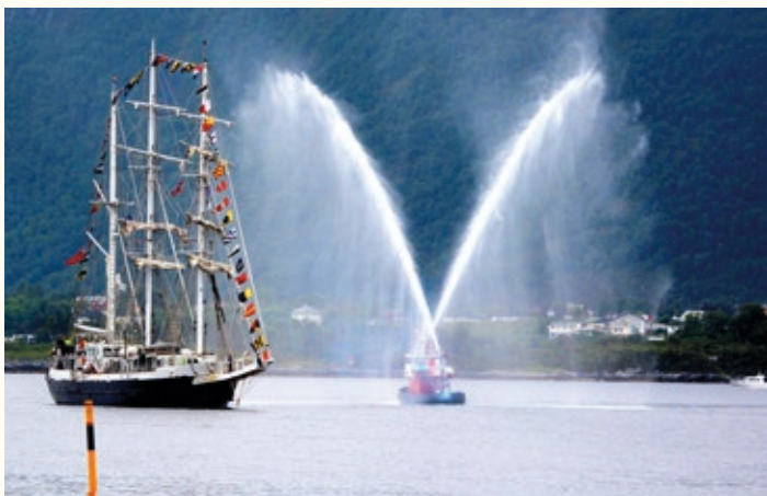
Lord Nelson” – engelsk Tall Ship blir hilste velkommen av den gamle brannsprøyta i Ålesund.