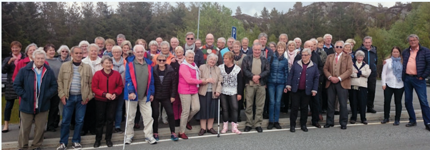
Bergenspensjonistene på besøk i Austevoll.

Etter en ny og vellykket tur til Sardinia i begynnelsen av mai, var det igjen duket for ny tur hos bergenspensjonistene. Fredag den 29. mai samlet 57 forventningsfulle medlemmer seg utenfor Sentrum politistasjon, for bussavgang til Austevoll. Hovedattraksjonen var lunsj på Bekkjårvik Gjestgiveri med nybakt verdensmester i kokkekunst.