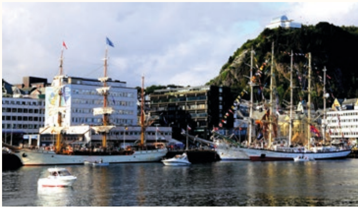
“The Tall Ships” – de høye skipenes master ruver i Ålesund.