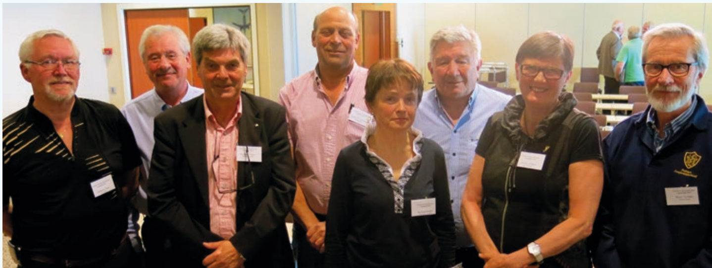
Det nye forbundsstyret samlet for første gang. Nå skal det jobbes!

til endringer i PPF og arbeidet med vedtektsendringer. (Begge disse ajourførte dokumentene kan leses på www.politipensjonisten.no ). Styrets vedtektsendringer m.m. er innarbeidet i disse dokumentene.