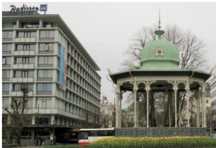
Landsmøtet til Norsk Pensjonistforbund var på det gamle hotell Norge i Bergen straks ved Musikkpaviljonen.