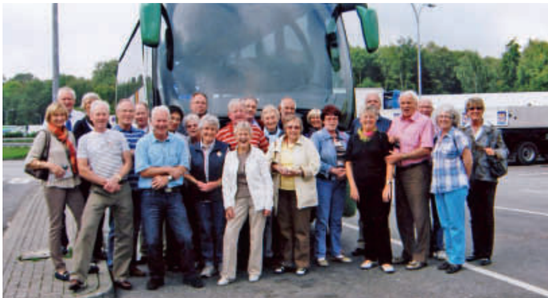
Pensjonistbussen med politipensjonister til Østerrike.