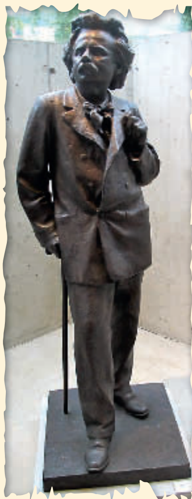
Ingebrigt Viks statue av komponisten Edvard Grieg.