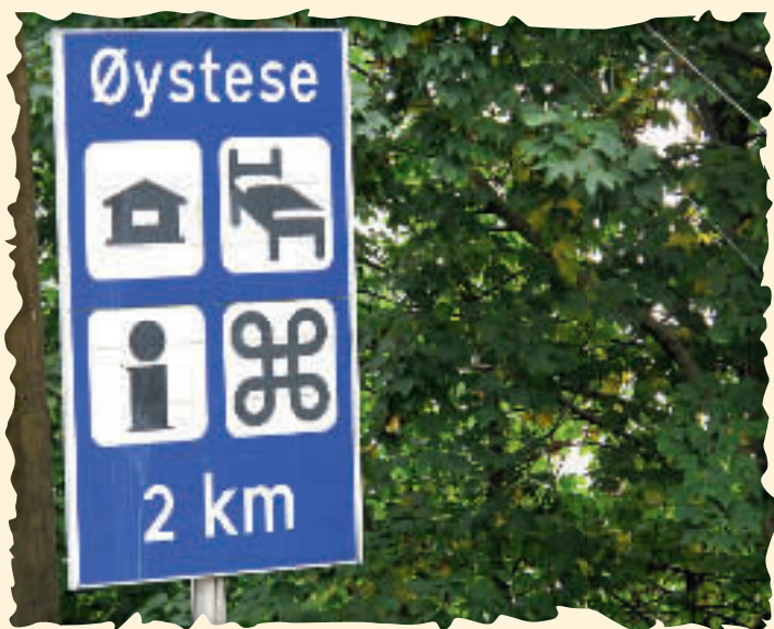
Motiv fra det vakre Øystese i Hardanger.