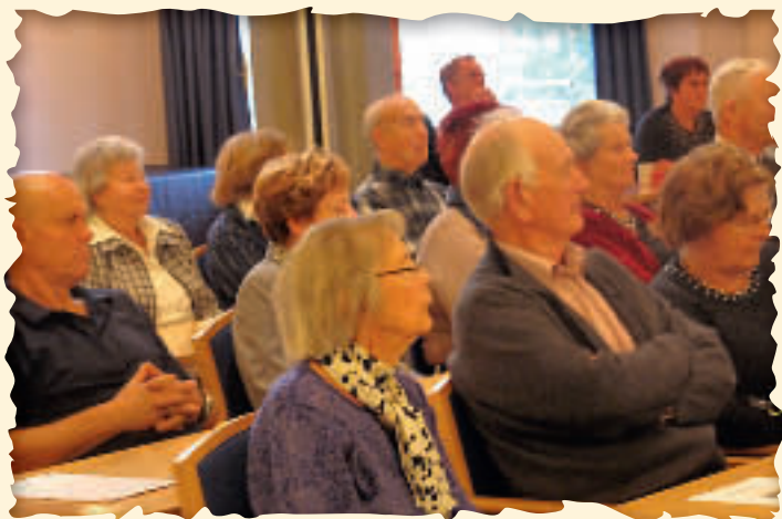
Forsamlingen følger nøye med.