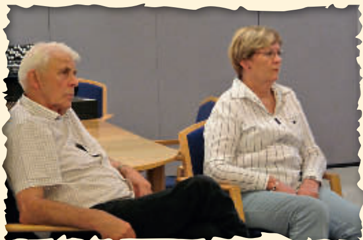
Interesserte seminar deltakere.