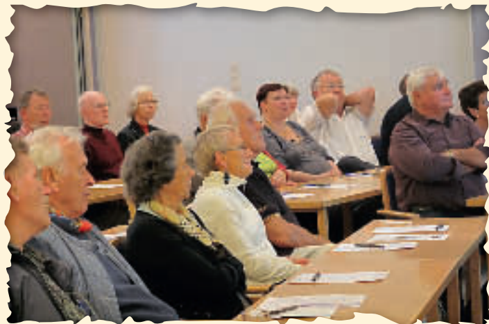
Foredragsholderne fikk stor oppmerksomhet.