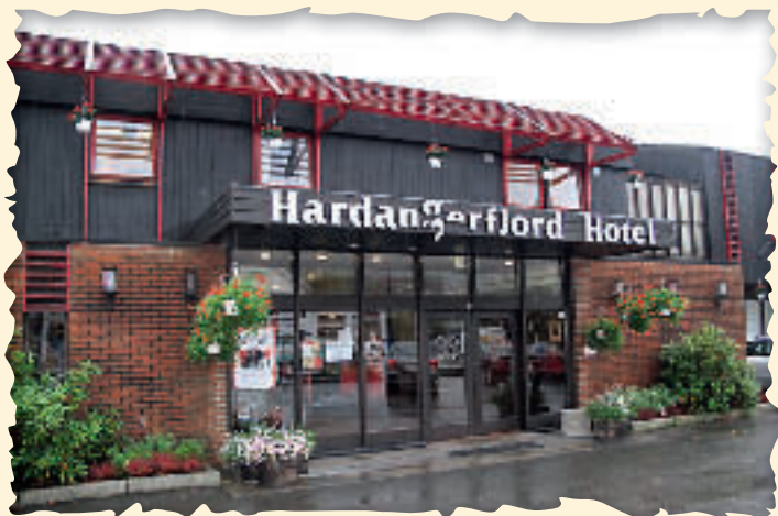
Hardanger Fjordhotell var stedet for å ha seminar.