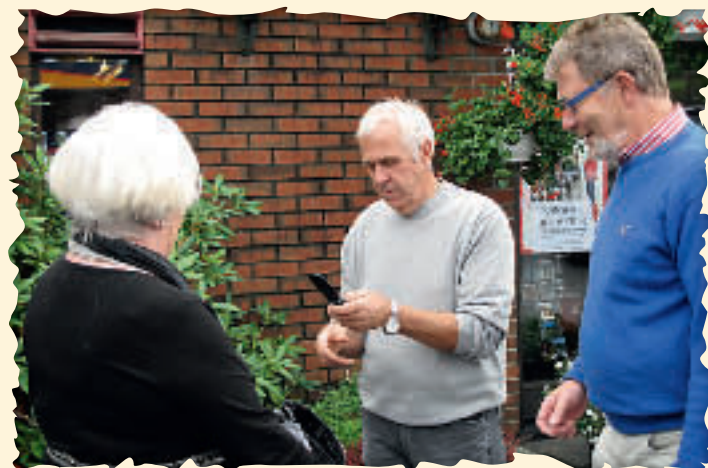
Diskusjonene foregikk både inne og ute.