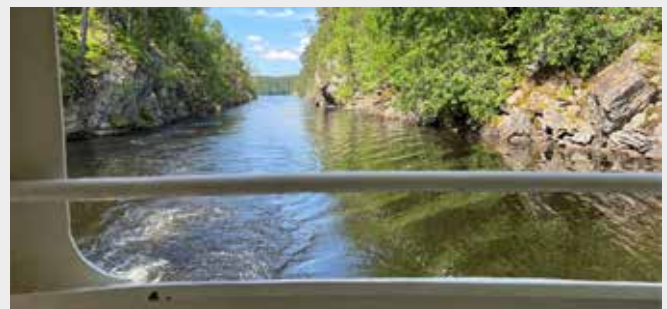
Her var det trangt.

komme til Brekke sluser. Alternativet er taxi fra/til Halden. Turen er ikke for dem som ønsker å tilbringe tiden med nesene i mobiltelefonen; det er dårlig/ingen dekning underveis. En av deltakerne lurte på om vi var kommet til Sverige da han fikk melding fra sin mobiloperatør og ble ønsket velkommen til EU.