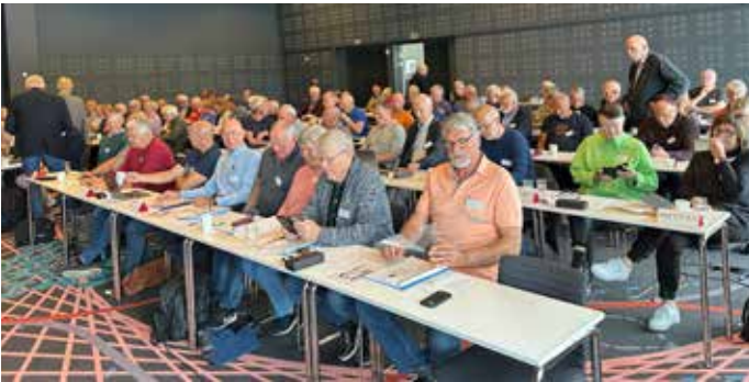
Den store møtesalen på Hotel Havet i Bodø egnet seg godt for PPFs landsmøte.

Valg er alltid siste post på landsmøteprogrammet - så også under PPFs landsmøte. Men det har neppe gått noen hus forbi