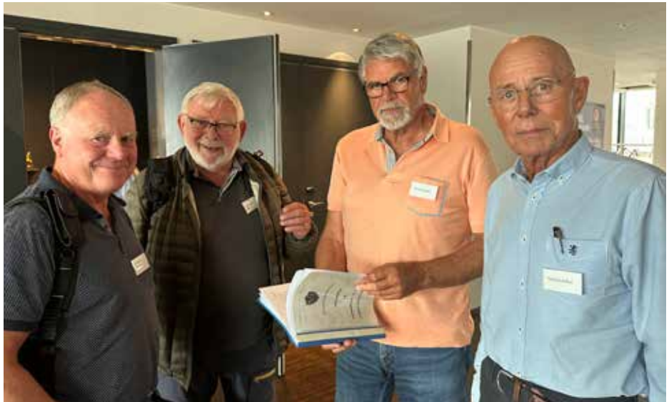
Vissheten om at verken du eller jeg er alene som politipensjonist er i seg selv en styrke. Her er en gjeng Bergenspolitipensjonister samlet under Landsmøtet i Bodø.

Men å se hverandre er så mangt. I PPF-sammenheng er møter i lag og foreninger den største sentrale møteplassen, men også de grupper som finnes i vår organisasjon - særlig innen tursporten. Å gå sammen er en fin måte å møte hverandre på. Å gå og snakke sammen og oppleve naturen er en optimal møteplass, fordi turen i seg