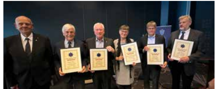
Årets Hederstegnnehavere. To mottakere var ikke til stede, men ble representert ved stedfortredere (de to lengst til høyre).