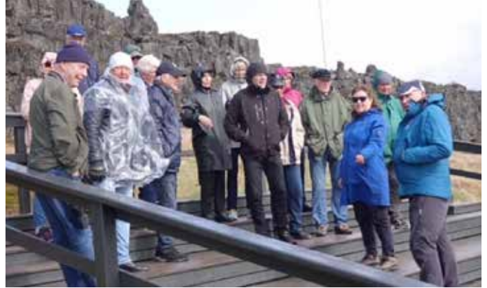
Deltakerne - interessert og lyttende.