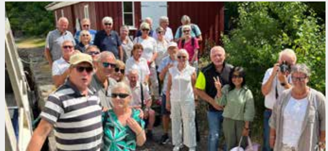
Fornøyde Mossepensjonister på tur.

Turen kan anbefales, men man er avhengig av egen bil for å