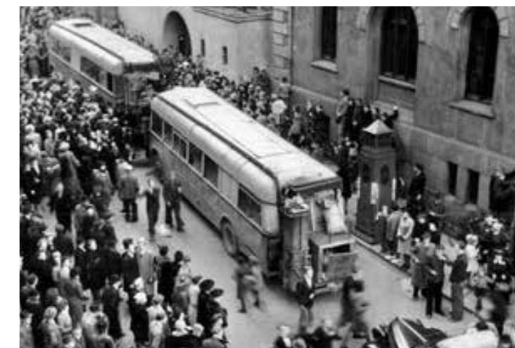
Fangene på Møllergata 19 ble kjørt i Sporveiens busser til Grini for registrering og frigivelse 8. mai 1945.