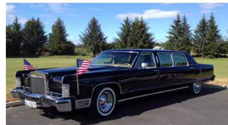
1977 Lincoln Continental Town Limousine.