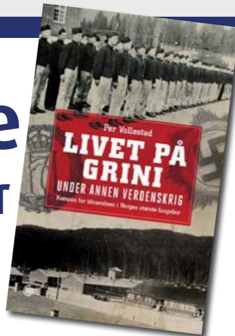
Ny historiebok om fangeleiren Grini - bedre sent enn aldri.

Rundt 20 000 mennesker satt fengslet på Grini utenfor Oslo i kortere eller lengre perioder i løpet av av krigsårene 1940-1945. De var alle som en – både kvinner og menn – gode nordmenn som på ulike måter gjorde sitt for å motarbeide nazismen, de ble tatt og ble fengslet. Av de 7 000 var det også mange polititjenestemenn og slektninger av kolleger fra hele Norge. Det er historie fra vår egen tid.