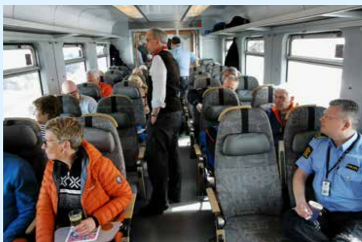
Mye å oppleve langs sporet.