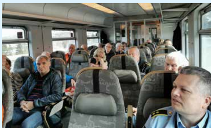
Glade politipensjonister på tur.