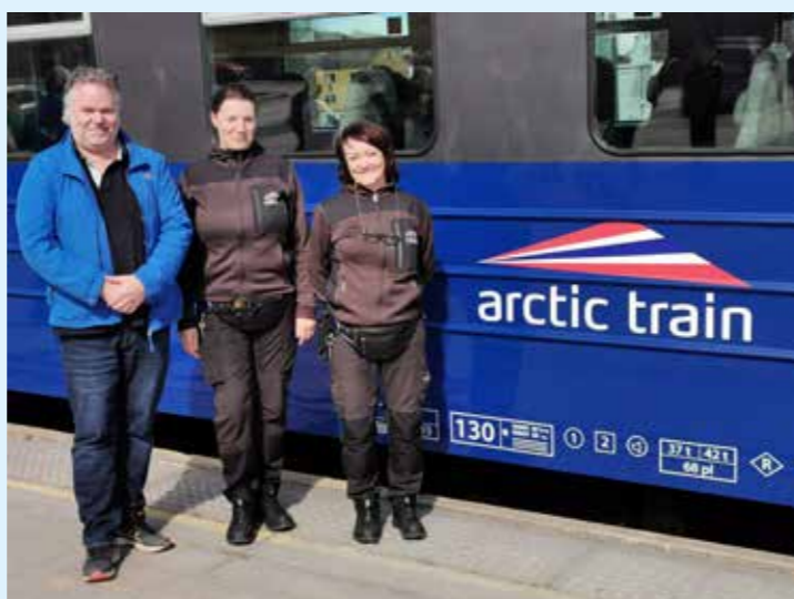
Vertskapet er på plass.