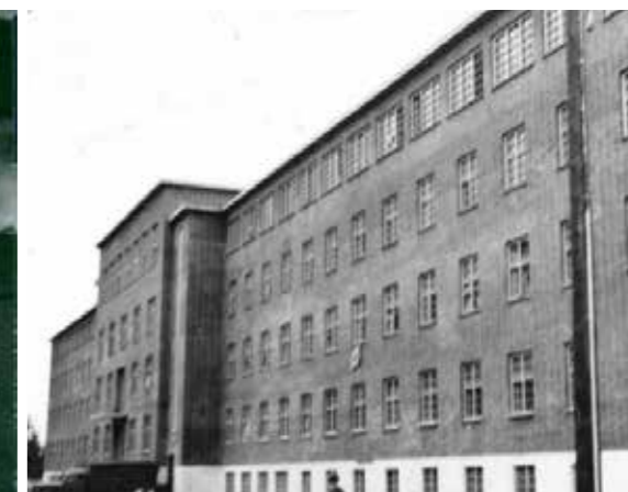
Slik så hovedbygningen på Grini ut i 1945.