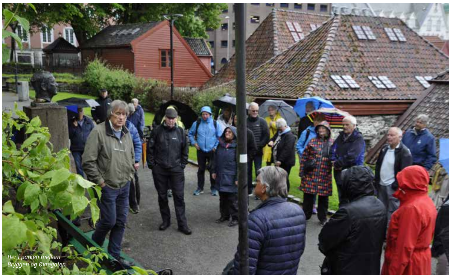
Her i parken mellom Bryggen og Øvregaten.