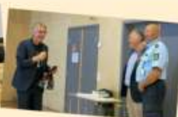
Å takke og være hundre prosent til stede er viktig i politipensjonistenes seniorkonferanser.