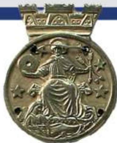
Brystmerke Oslo politi.

Begge bildene har lik signatur og må antas å være grafiske trykk, uten at dette kan verifiseres ut ifra kopiene